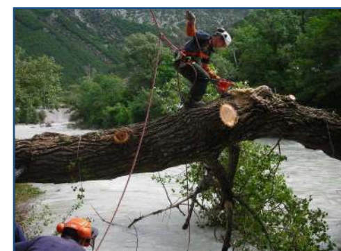
Entretien de cours d'eau