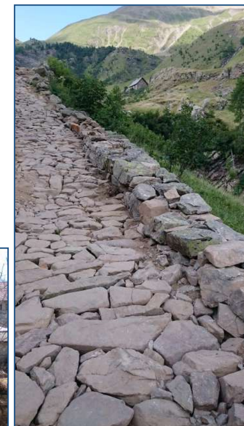
Dallage pierres sèches